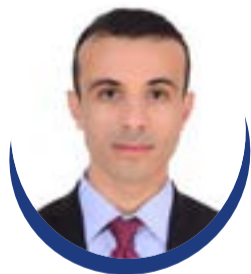
Par Yassine Andaloussi

Le Maroc n'évolue plus dans l'angle mort des dynamiques internationales. Qu'il s'agisse de sport, de diplomatie, d'infrastructures, de coopération Sud-Sud ou de choix économiques structu-