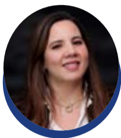
Par Sanae El Amrani

LE MONDE n'a jamais été pacifié. Il a seulement appris, pendant un temps, à se raconter autrement. Derrière les discours sur la coopération, le multilatéralisme et l'ordre fondé sur des règles, les rapports de force n'ont jamais disparu. Ils se sont dissimulés, habillés de procédures, de normes et d'un langage juridique destiné à rendre la domination plus acceptable. Aujourd'hui, ce décor se fissure. Non pas parce que la puissance serait de retour, mais parce qu'elle n'éprouve plus le besoin de se cacher.